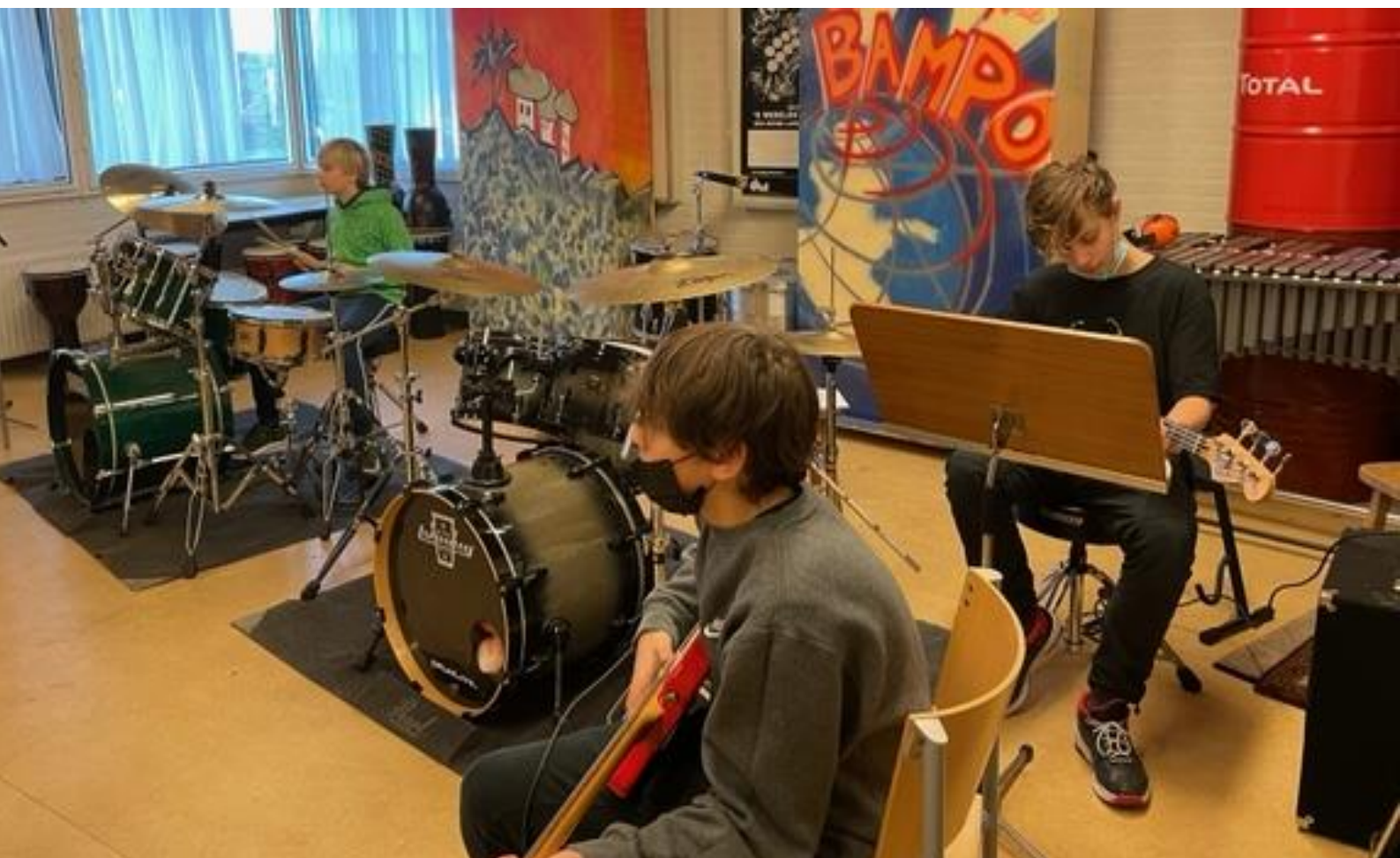
Leerlingen PCC Heiloo krijgen popbandles op de Muziek- en Dansschool Heiloo