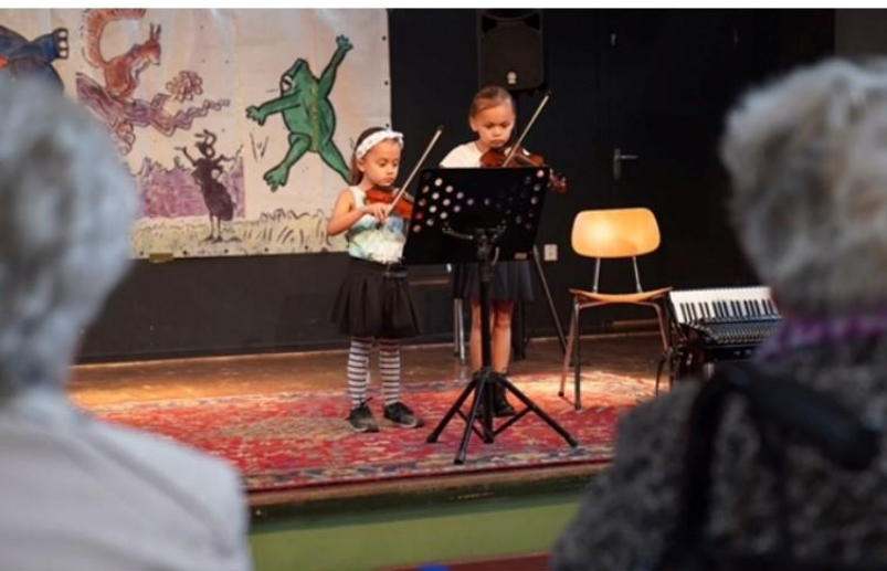
Foto: Jubileumconcertjes in verzorgingshuizen en bij de Muziek- en Dansschool Heiloo

De dans- en musicalafdeling hebben ook een feestelijk jaar achter de rug. De musicalleerlingen zijn naar zorginstellingen in Heiloo geweest voor een optreden met liedjes uit Ja Zuster, Nee Zuster . De dansafdeling heeft het podium dit jaar meerdere malen gebruikt vanwege voorstellingen maar ook met veel open lessen.