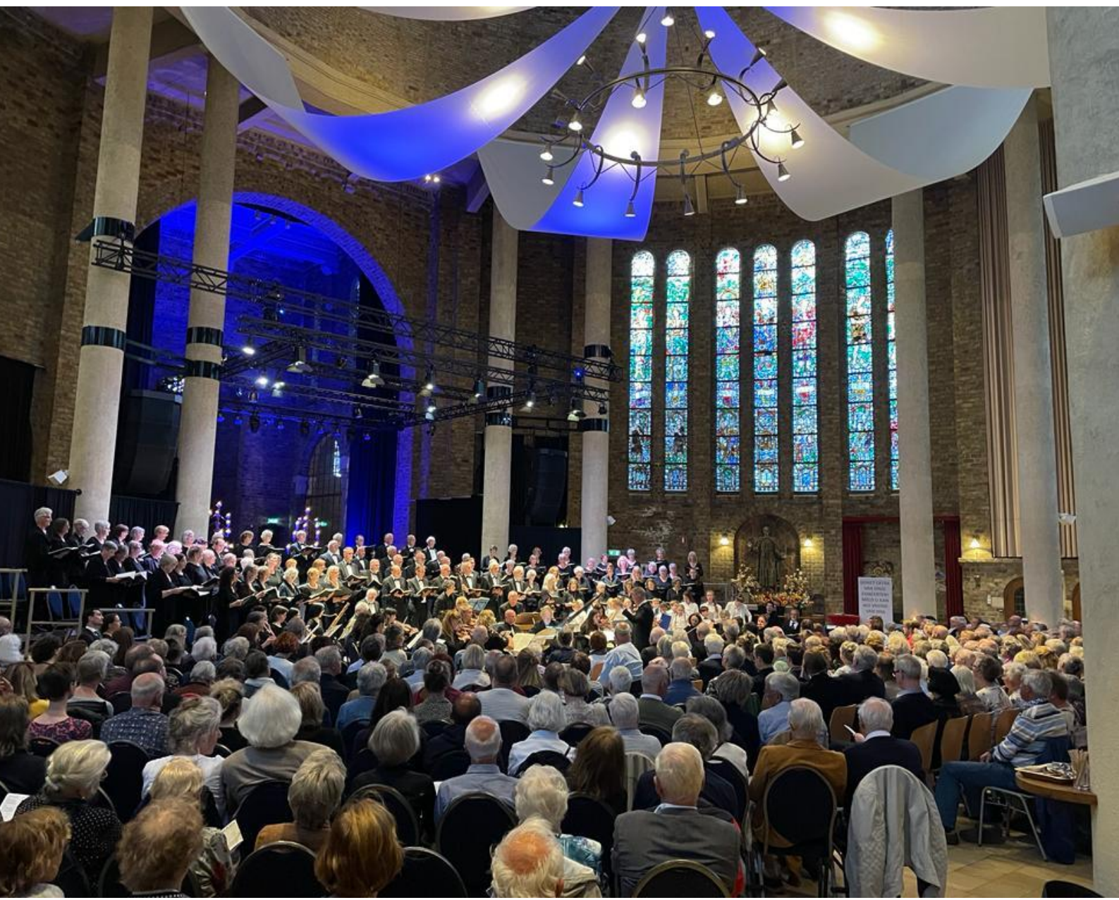
Foto: het kinderkoor (rechts vooraan in de witte blouses) treedt op met het Oratoriumkoor

In 2023-2024 zal verkend worden hoe we bijzondere doelgroepen kunnen bereiken met speciaal cursusaanbod.