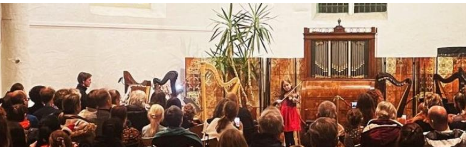
Foto: Winterconcert in De Witte Kerk