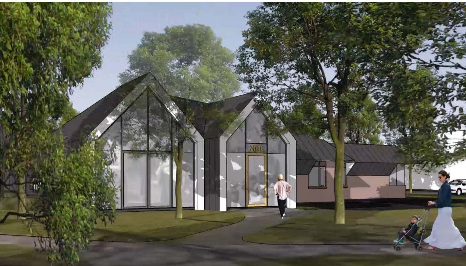
Foto: een schets van het zijaanzicht van de nieuw te bouwen zaal