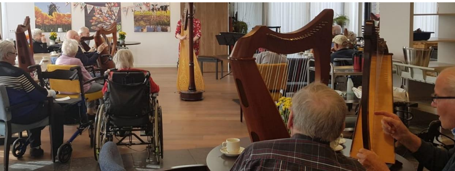
Foto: harpworkshop in verzorgingshuis

De Muziek- en Dansschool Heiloo besteedt steeds meer aandacht aan speciale doelgroepen. Normaliter vinden er concertjes plaats in diverse tehuizen. Om iets goed terug te geven aan de maatschappij en om meer docenten en cursisten kennis te laten maken met de zorginstaties en hun cliënten in Heiloo, is besloten om ter gelegenheid van het 60-jarig bestaan van de Muziek- en Dansschool Heiloo, concerten bij alle zorginstaties in Heiloo te organiseren. Een mooie opmaat naar meer aanbod voor speciale doelgroepen.